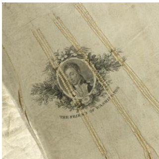
Inv. SN 5876 Détail. Paire de gants d'homme avec l'inscription « The Friend of Washington » Milieu du 19 e siècle ? Impression sur peau.

Autant de thèmes qui permettent au visiteur d'appréhender avec un regard différent l'histoire des tissus et la richesse des collections du Musée des Tissus et d'appréhender les riches relations entre l'Amérique et Lyon.